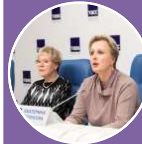
Пресс- конференция в Итар-ТАСС