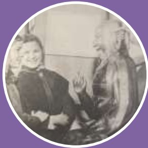
Атрибуция буддийской скульптуры