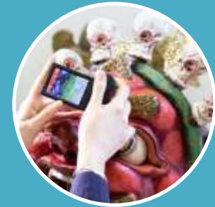
Реставрация масок мистерии Цам