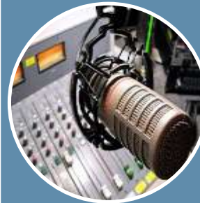
Совместный цикл программ «Культурный мост» с радиостанцией «Питер FM»