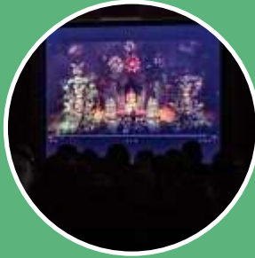
Презентация фильма «История одного МИРа»